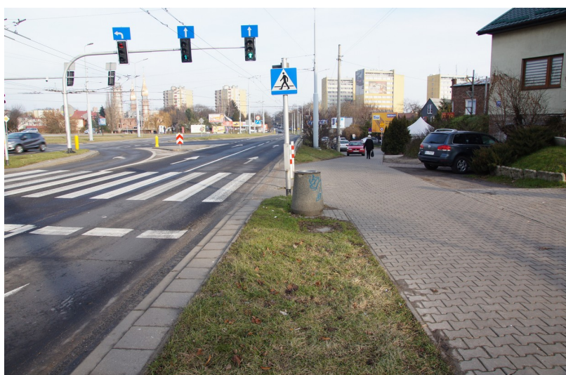
Ilustracja 2: Ulica Nadbystrzycka