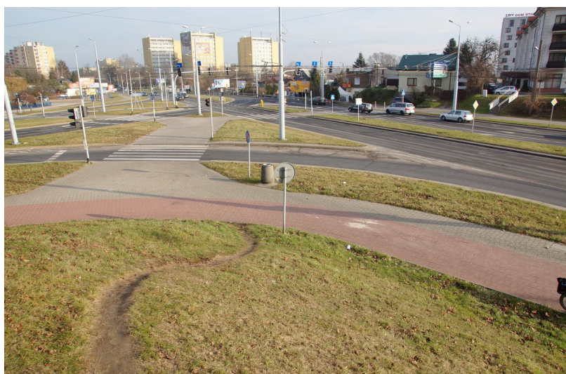
Ilustracja 1: Ulica Nadbystrzycka