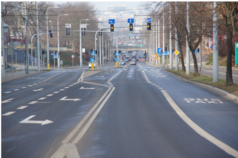
Ilustracja 1: Ulica Droga Męczenników Majdanka