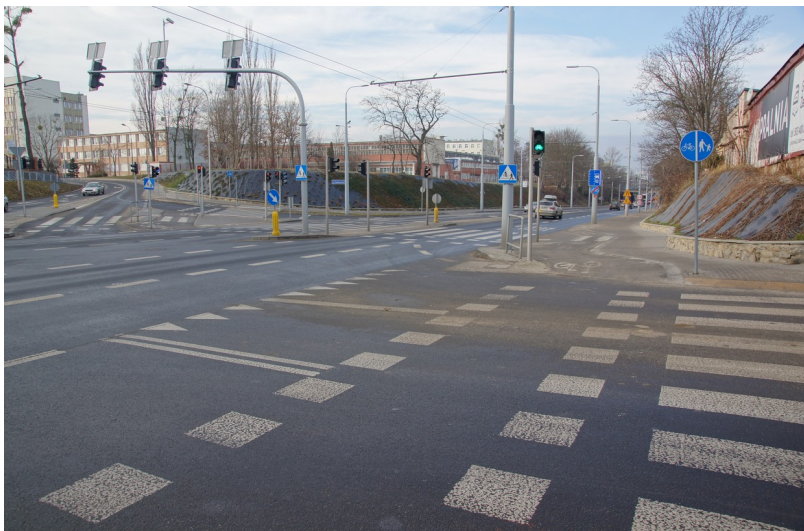
Ilustracja 2: Ulica Droga Męczenników Majdanka – koniec DDR