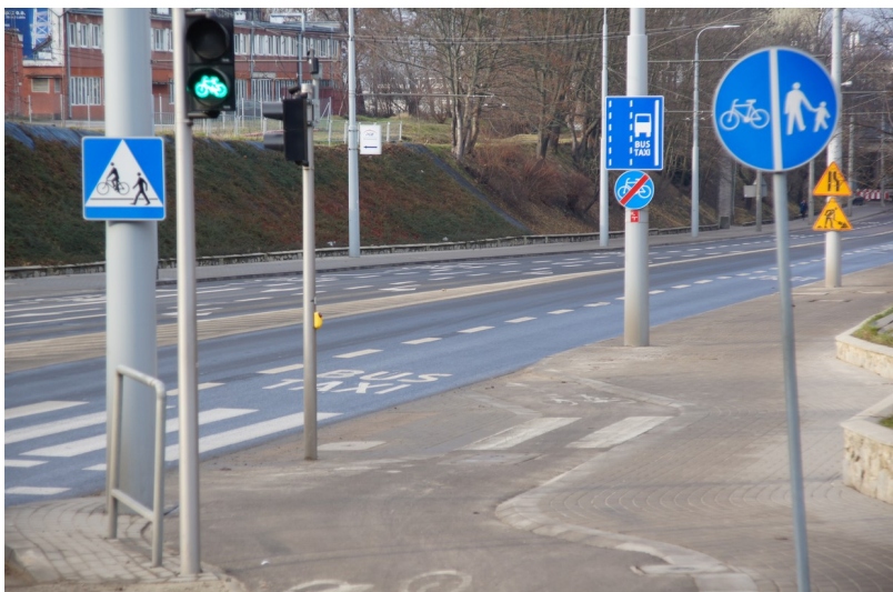
Ilustracja 3: Ulica Droga Męczenników Majdanka – koniec DDR