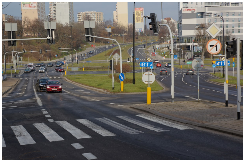
Ilustracja 1: Ulica Lubomelska, w tle Kompozytorów Polskich